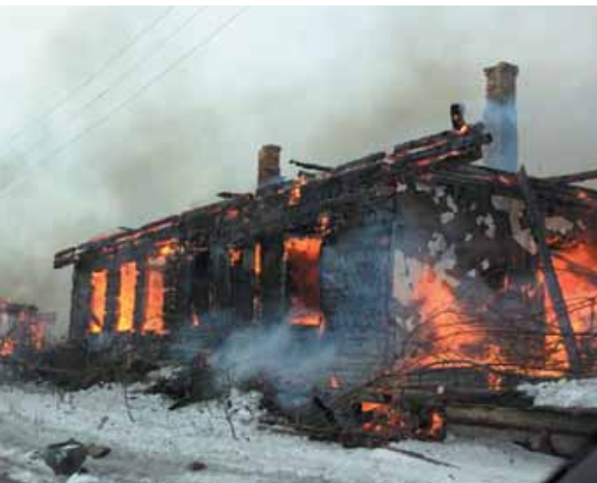
Подготовка ложа Богучанского водохранилища.