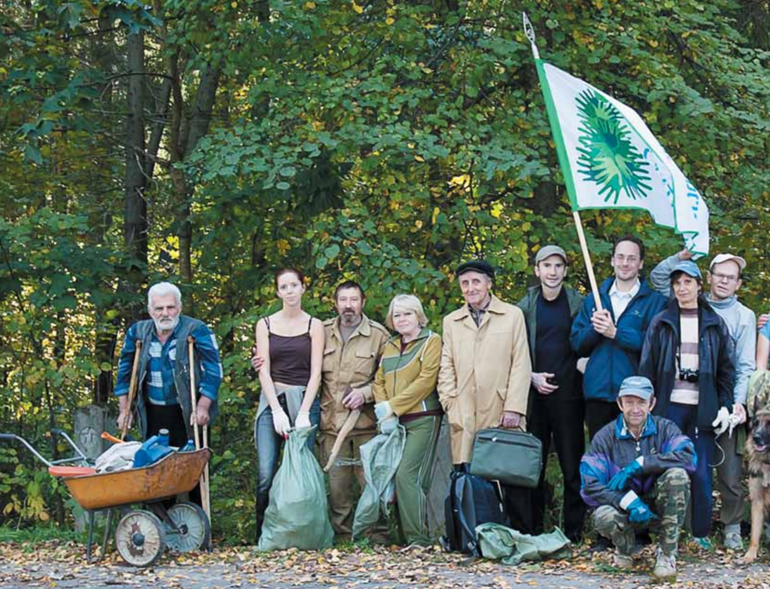
Группа защитников Сиверского леса провела субботник, очистив от мусора прибрежную зону Оредежа.