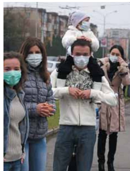
«Стоп «Электроцинк»!». Пикет 4 ноября 2009 года.