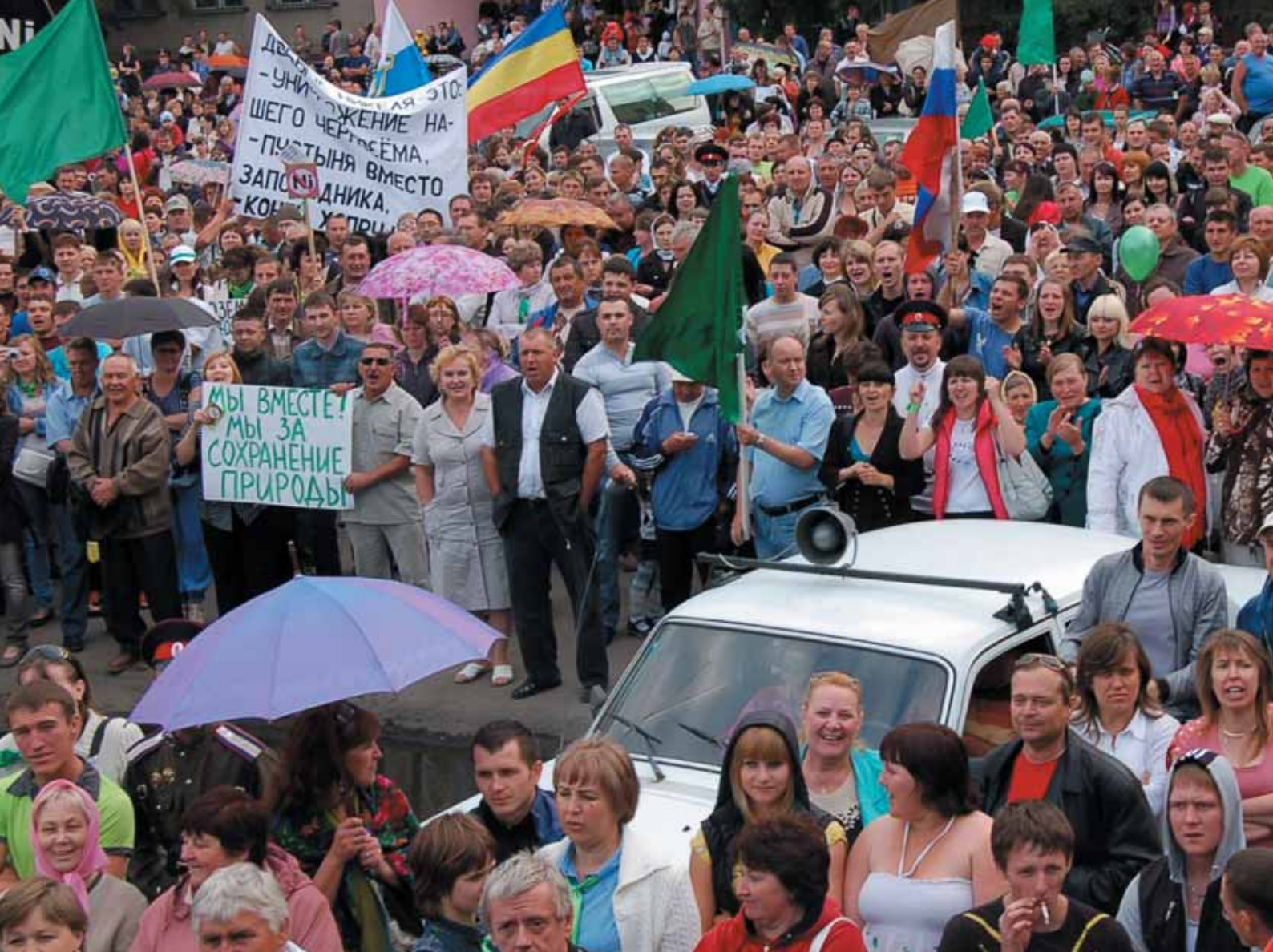
Митинг против добычи никеля в Черноземье. Борисоглебск, 3 июня 2012 года.