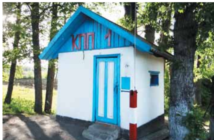
КПП при въезде в поселок Садовый, где находится колония, в которой отбывает срок Евгений Витишко.