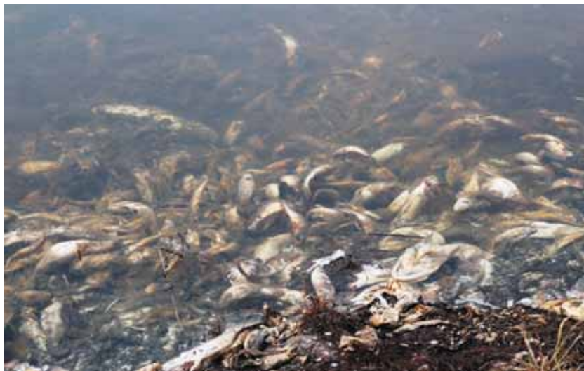
Заморы рыбы при сооружении и эксплуатации водохранилищ – нередкое явление.

сообщали о махинациях, связанных с программой переселения. О том, как в поселках появлялись пришлые люди, получавшие статус местных. Обращения в районную администрацию, прокуратуру, правительство, Заксобрание, губернатору оставались без результата. Лишь после публикаций в краевой прессе прокуратура предприняла меры, и факты, о которых сообщали жители, подтвердились.