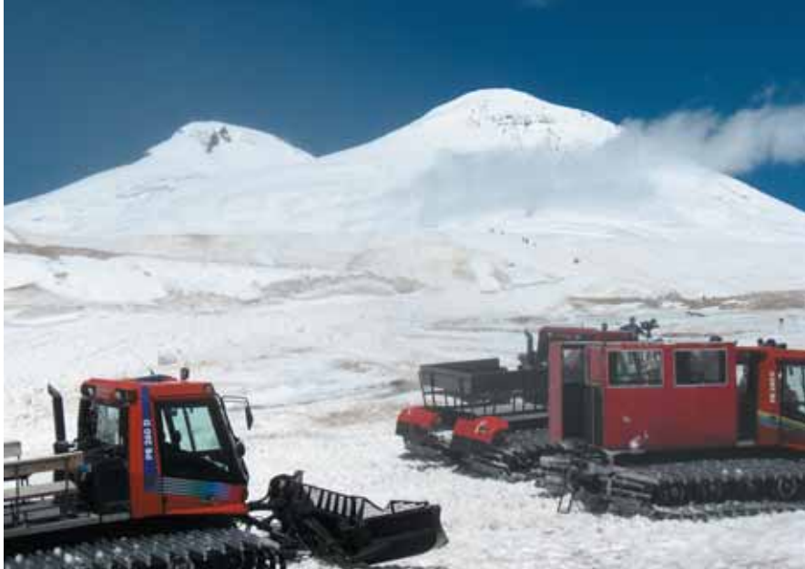
Горнолыжные ратраки на склонах Эльбруса. Так высоко в Приэльбрусье (до 4 тыс. м над уровнем моря) лыжники и любители сноубординга никогда прежде не забирались.