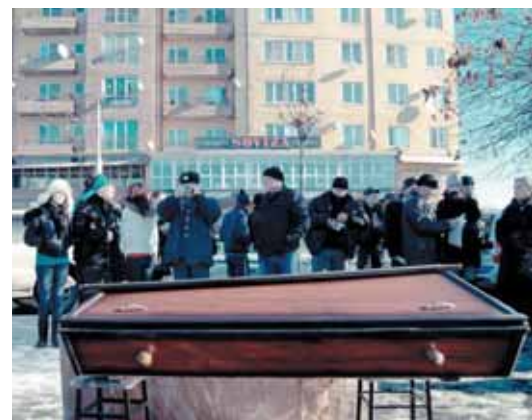
«Стоп «Электроцинк»!». Пикет 5 января 2012 года.