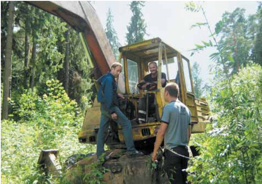
Активисты, возмущенные строительными работами на одном из участков в лесу, блокировали технику.

имуществом. «Созданную» с помощью бумажных ухищрений территорию сняли с учета.