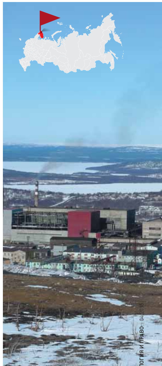
Плавцех в Никеле.

ских экосистем, вызванных хозяйственно-экономической деятельностью предприятий ГМК «Норильский никель», стараясь привлечь к этому внимание общественности и властей.