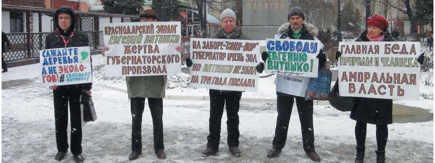
Акция в поддержку Евгения Витишко в Воронеже. Март 2014 года.