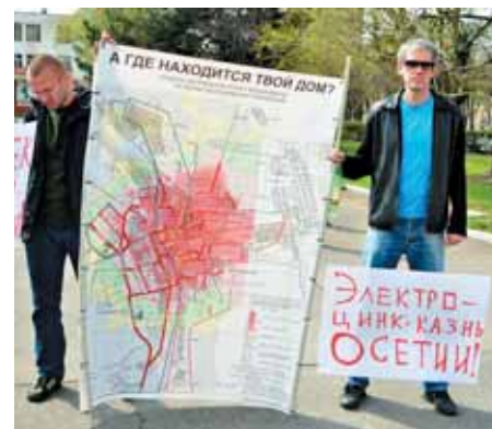
«Стоп «Электроцинк»!». Пикет 6 апреля 2013 года.