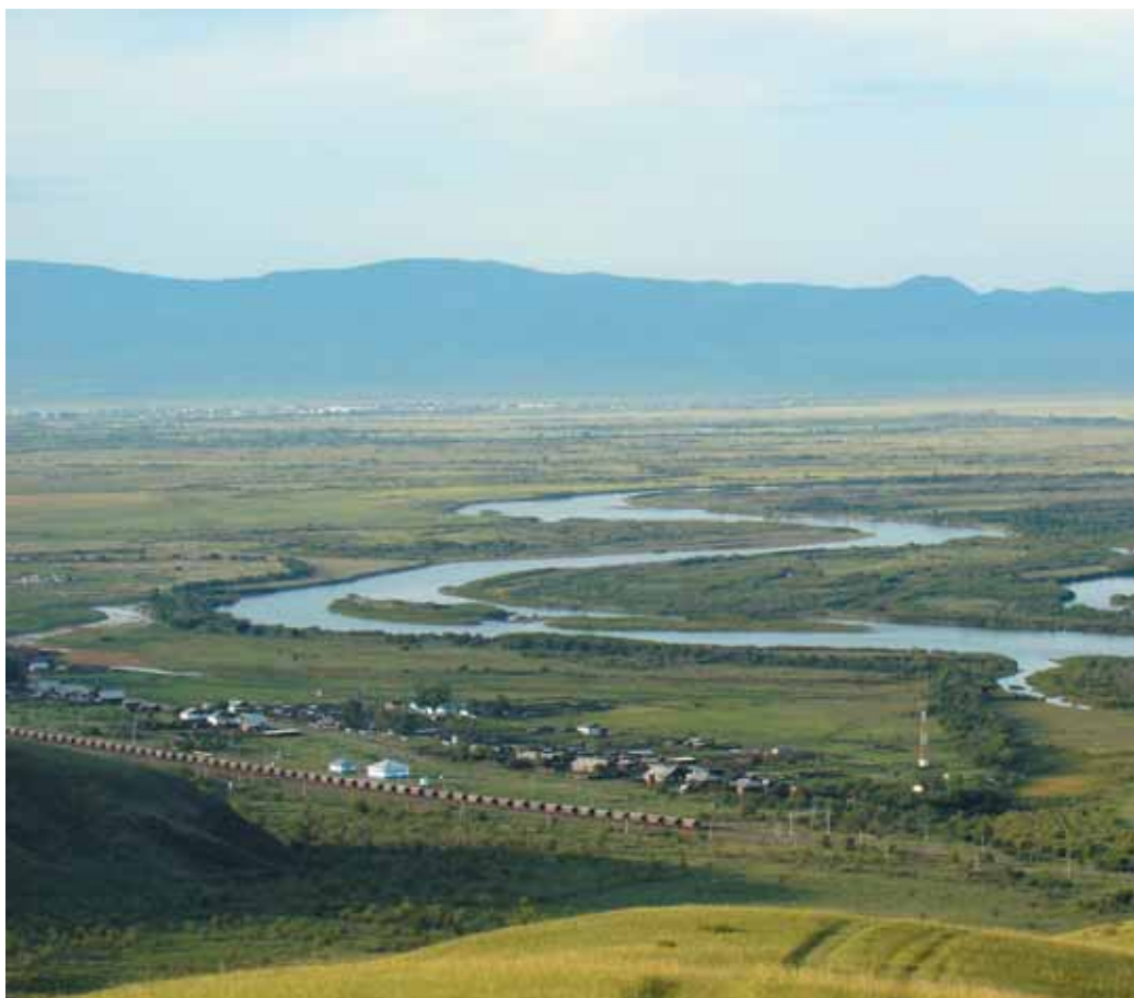
В феврале 2015 года жители региона реки Селенги из России и Монголии обратились в Инспекционную комиссию Всемирного Банка с требованием отложить финансирование опасных проектов ГЭС в Монголии. На фото: река Селенга – кормилица села Зарубино.

Истинная цена гидроэнергетики раскрывается в недавнем исследовании Оксфордского университета. Оно демонстрирует, что большие плотины обычно не окупаются. Проанализировав 245 проектов в 65 странах, ученые пришли к выводу, что в современных условиях строительство крупных ГЭС всегда (!) невыгодно и проигрывает в сравнении с развитием возобновляемых источников энергии, не говоря уже о повышении энергоэффективности.