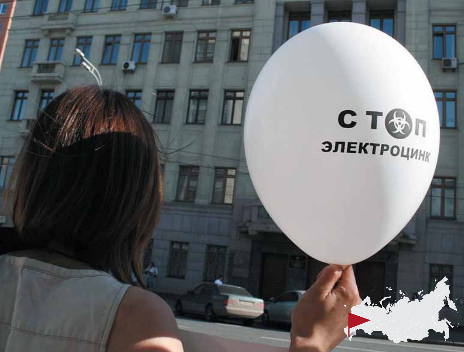
Пикет перед зданием Ростехнадзора в Москве. 28 июня 2010 года.