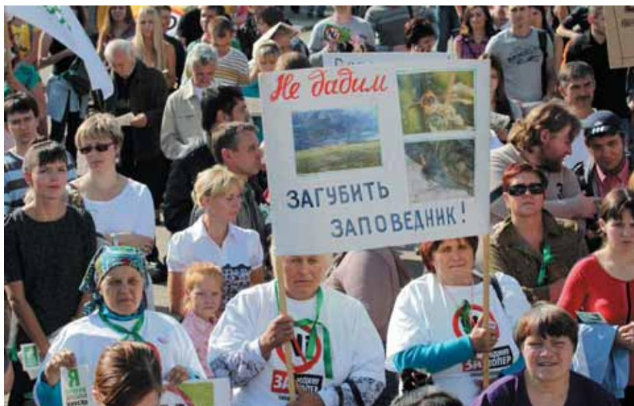
Митинг в Воронеже. 22 сентября 2012 года.

Активисты полагают, что данный проект невыгоден региону не только с социально-экологической, но и с экономической точки зрения, так как добывать цветные металлы в регионе будет структура Уральской горно-металлургической компании, принадлежащая сети кипрских фирм, собственниками которых, в свою очередь, являются офшоры, расположенные на Британских Виргинских островах. При этом более 90% добываемого сегодня в России никеля вывозится за рубеж, а недавно были отменены вывозные пошлины на никель и медь. При текущей цене (14-16 долл. за кг) разработка Еланского и Елkinsкого месторождений абсолютно нерентабельна, в связи с этим неизбежны экологический демпинг и перекладывание рисков со стороны компании на государство за компенсацию экологического ущерба.