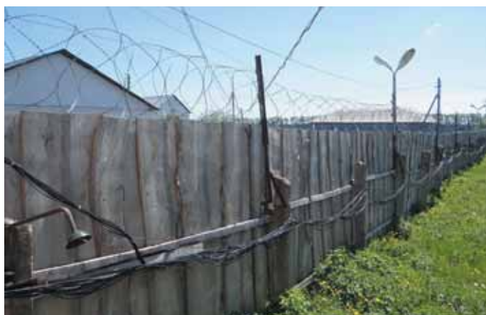
Баракы для содержания заключенных за забором колонии.