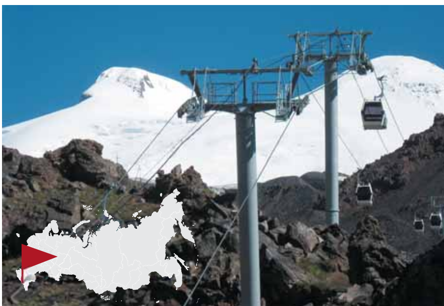
В 2000-е годы зона хозяйственного освоения Эльбруса поднялась до границы вечных льдов, ускоряя сокращение их площади из-за глобального изменения климата.