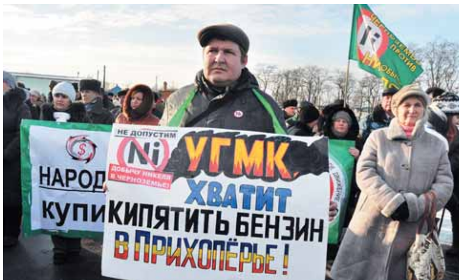
Митинг в Новохоперске собрал около 3000 участников. 8 декабря 2013 года.