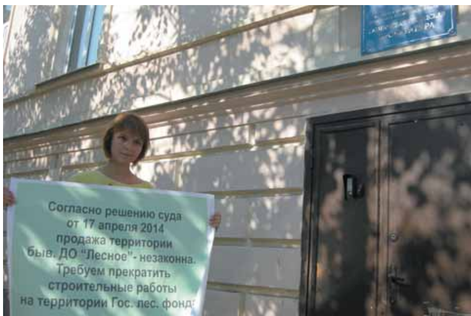
Пикет у Гатчинской прокуратуры. Защитница Сиверского леса напоминает о недавнем решении суда, признавшем незаконным договор купли-продажи 136 квартала Зареченского лесничества, и требует прекращения незаконных работ на участках. 7 августа 2014 года.

Некоторые собственники уже пытаются избавиться от проблемных участков, выставляя их на продажу. Инициативная группа ждет результатов судебных процессов и надеется на благоприятный для зеленой зоны исход дела. Однако сколько времени продлятся разбирательства и когда незаконно приватизированный лес вернут государству – пока неизвестно.