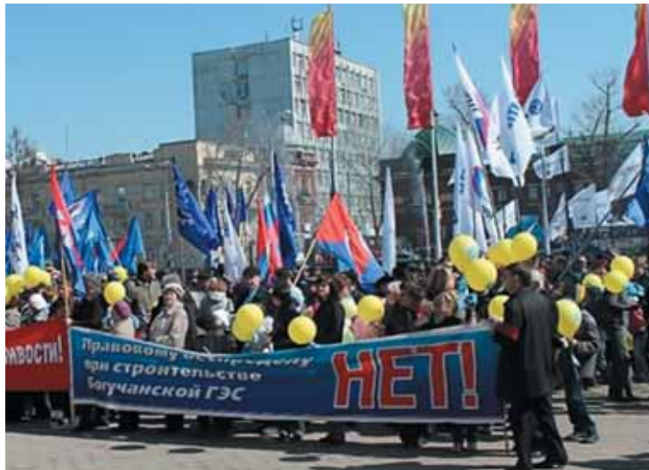
Протест против Богучанской ГЭС в Иркутске.

Подготовлено Красноярским общественным объединением «Плотина.Нет!»