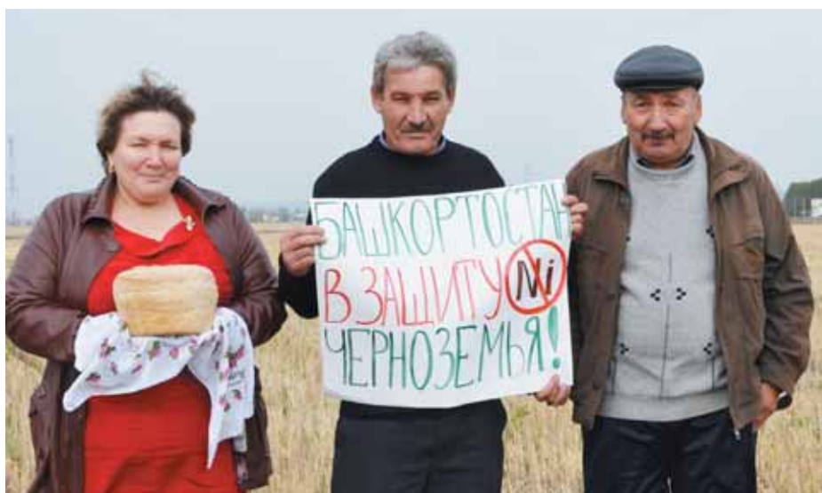
Акция солидарности в 50 городах. 28-29 сентября 2014 года. На фото – жители Башкирии.