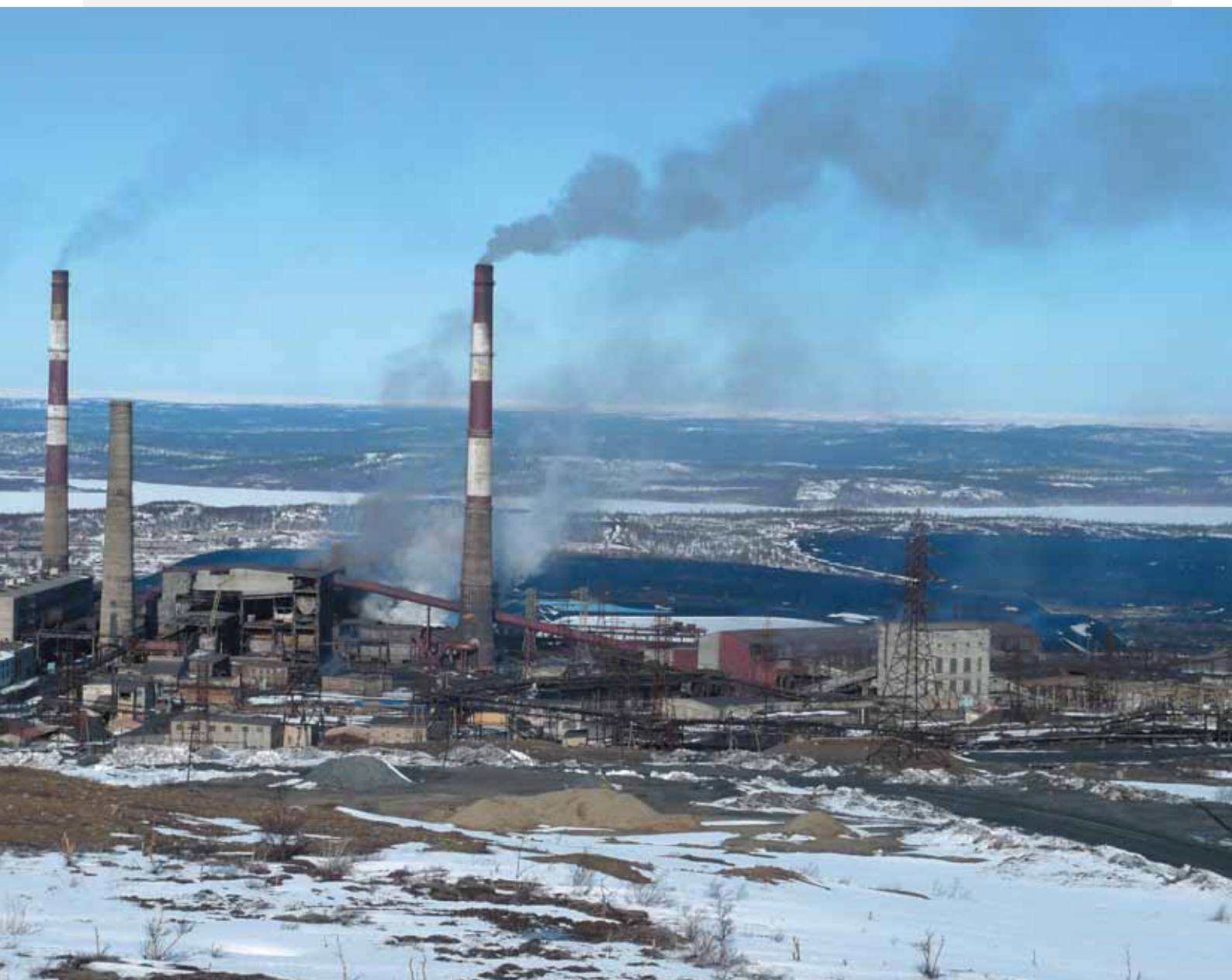
Доход для областной экономики – ущерб для северной природы на границе России, Норвегии и Финляндии.

Скачать доклад можно на сайте www.bellona.ru в разделе «Публикации».