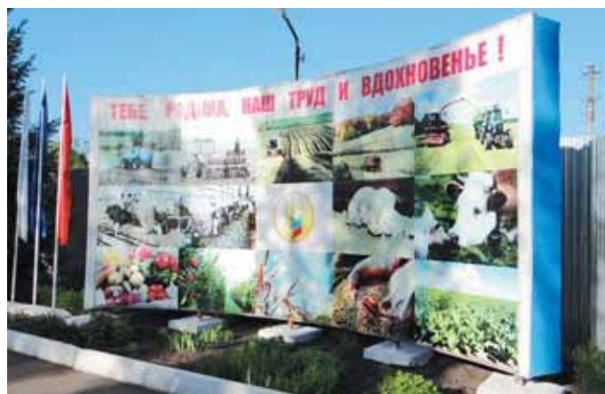
Стела-пародия в колонии-поселении № 2.