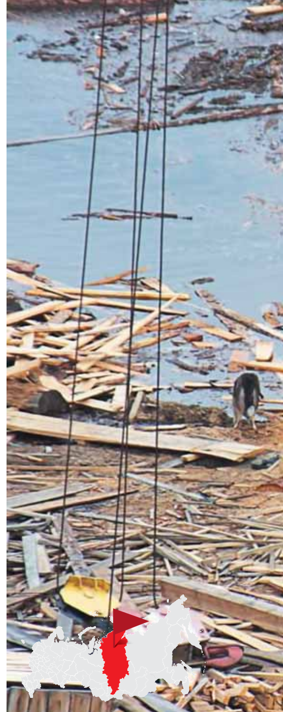
Заполнение Богучанского водохранилища.

В планах перспективного развития гидроэнергетики стоит освоение потенциала рек Северного Кавказа: Зарамагские, Кашхатау, Гоцатлинская ГЭС, Зеленчукская ГЭС-ГАЭС; в планах – вторая очередь Ирганайской ГЭС, Агвалин-