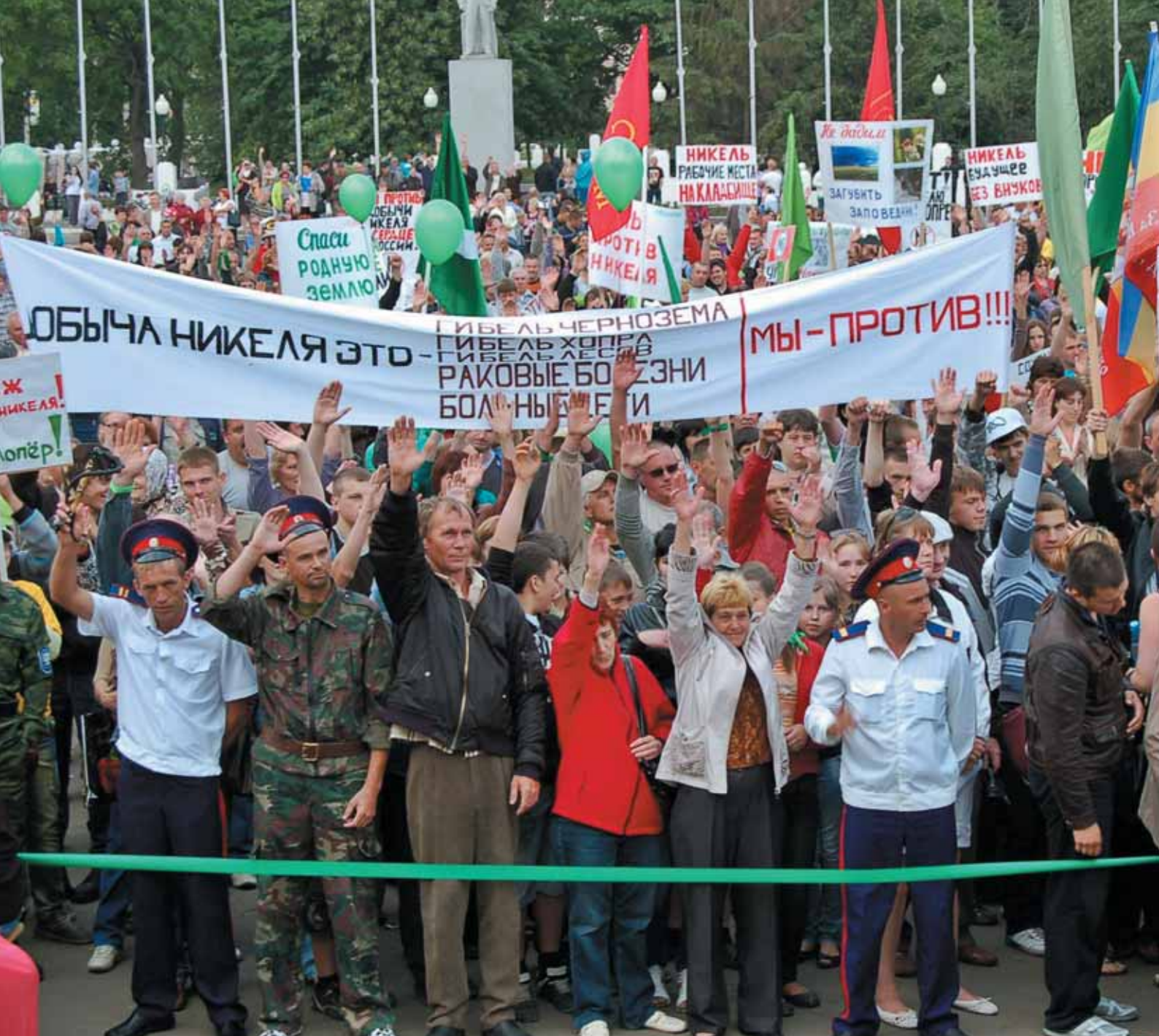
Митинг против добычи никеля в Черноземье. Борисоглебск, 3 июня 2012 года.