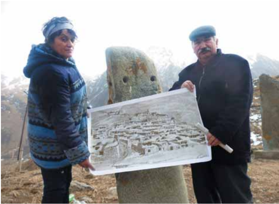
Местные жители опасаются, что масштабная стройка уничтожит остатки селения Шыкы – родину основоположника балкарской литературы Кязима Мечиева.