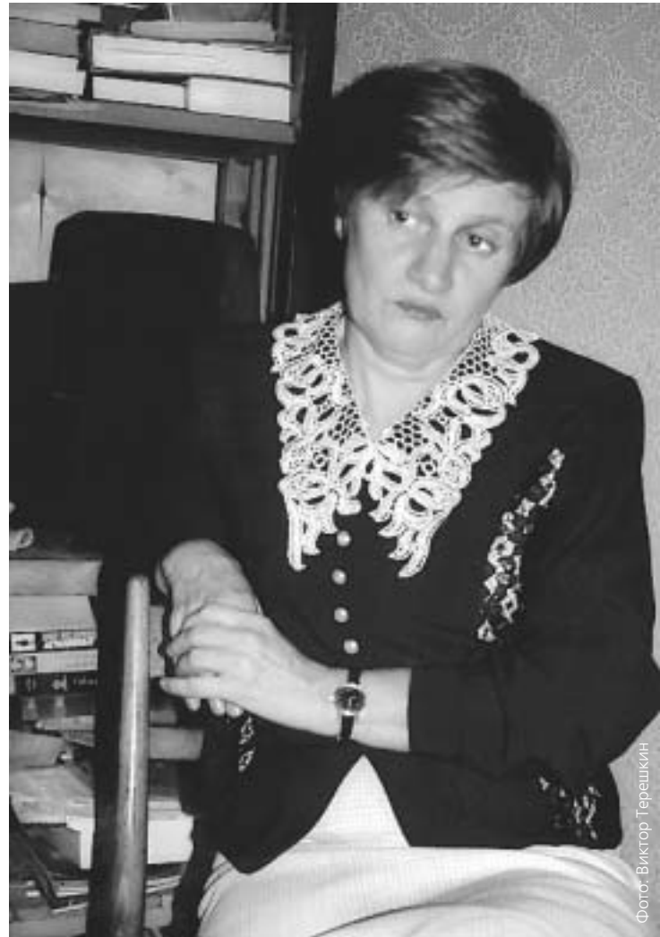
На снимке: мама Игоря

Сегодня вызывает обеспокоенные сомнения состав и независимость присяжных. Иначе зачем было распускать первую коллегия и заменять ее новой. Под сомнениями лежат вполне серьезные основания: принципиальные различия в социальном положении присяжных. Кроме