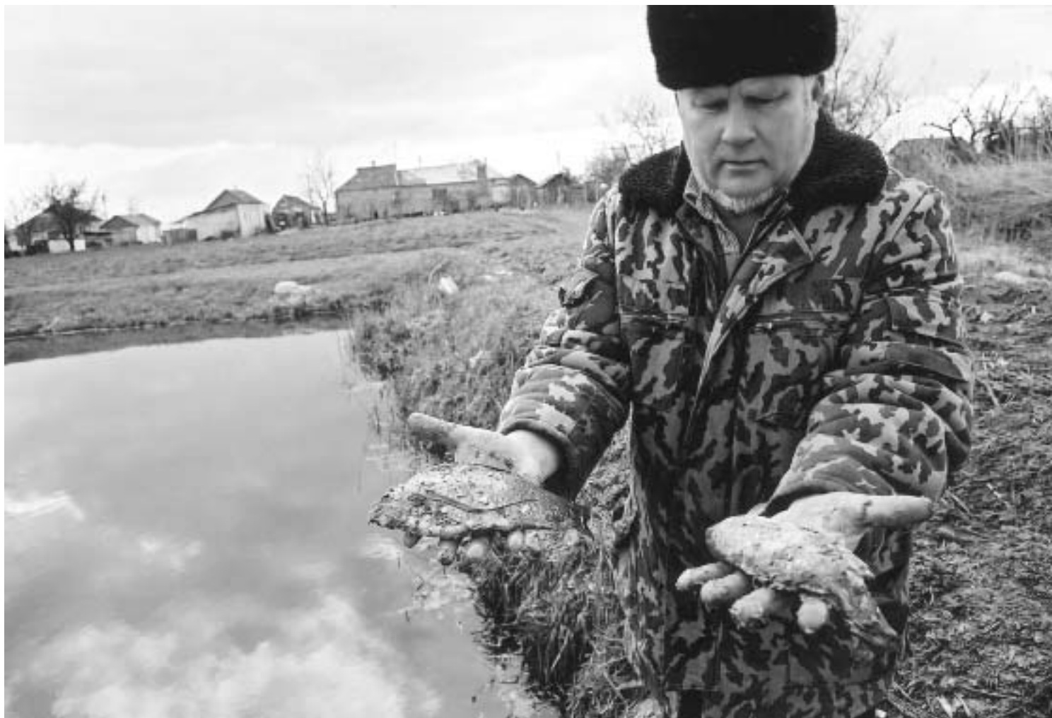
На снимке: погибшая рыба покрылась липкой эмульсией

здоровью местных жителей в результате газоконденсатного загрязнения воздуха. И началась повторная эвакуация. Показавшая со всей наглядностью неуклюжесть попыток «Газпрома» и властей имитировать «полную нормализацию жизни в зоне аварии». Территория хутора, заросшие тростником плавни были покрыты толстым слоем желтой эмульсии твердых фракций углеводородов. На поверхности водоемов эмульсия принимала вид желтой пены толщиной до одного метра.