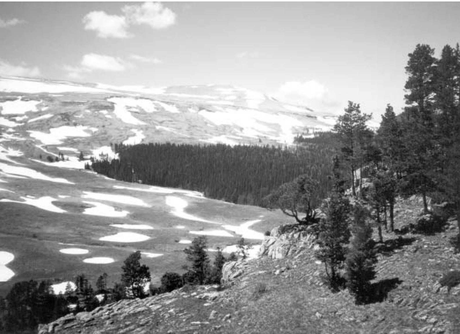
На снимке: Плато Лагонаки весной