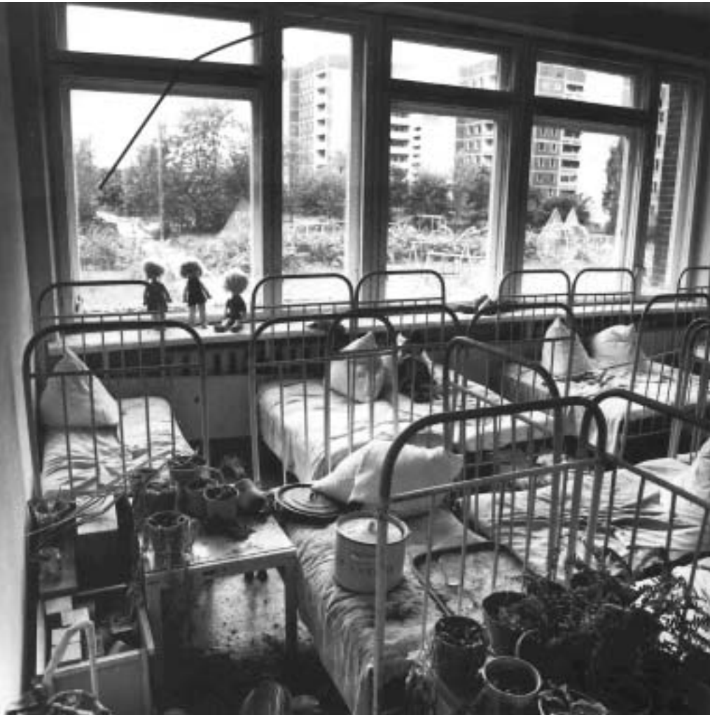
На снимке: детский сад в Припяти

го-то из детей любила больше других. На его кровати и расположилась, так как остальные были не тронуты, а на этой покрывало было очень грязное и смятое. Она еле сползла со своего места и подошла ко мне. Я ужаснулась ее виду. Нижняя часть лап была лишена шерсти, голое мясо кровоточило. Из рта тонкой струйкой непрерывно текла слюна. Глаза были мутные. Я даже не поняла, видит ли она что-либо. У нее был внешний бета-ожог, так как она уже год ходила по радиационно-загрязненной почве и растительности. А внутренний ожог был от того, что ела «грязных» грызунов.