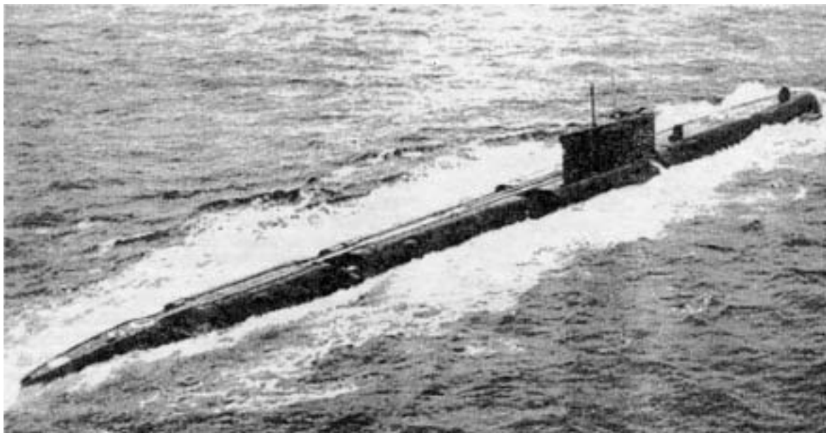
Однотипная К - 431 атомная подводная лодка проекта 675 (Эхо II по классификации НАТО)

Ещё в начале 50-ых, когда в СССР было принято реше-