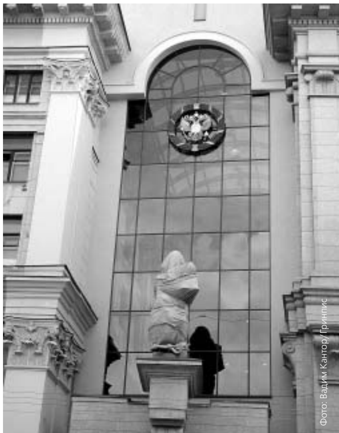
На снимке: статуя Фемиды на здании Верховного Суда

Это ж не Путина В.В. нынче выбрали, а клетку, в которой легко, потому что все понятно: звук — удар плеткой, поджатый хвост — миска с требухой. Порядок и справедливость. А если кто совсем уж невзначай попал под паровой каток — покаяйся, что вовремя не отполз в сторону, понадеявшись на правила дорожного движения.