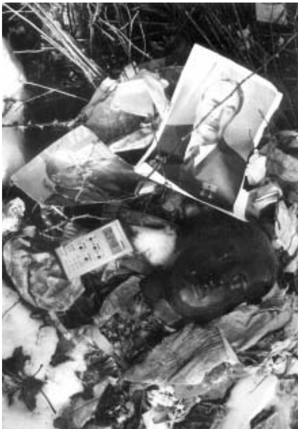
На снимке: чернобыльский мусор

Те, кого так или иначе затронула чернобыльская катастрофа, в последнее время с горечью наблюдают, как идет наступление на льготы, установленные базовым Чернобыльским Законом. Кому выгодно объявить мифом последствия чернобыльской аварии, принесшей людям столько бед? На руку это тем, кто хотел бы укрепить бюджет страны за счет полного истребления ликвидаторов аварии и прекращения финансирования работ по преодолению последствий чернобыльской катастрофы. Министр Починок был инициатором многочисленных решений, ущемляющих социальные права ликвидаторов. Его позиция — экономить и экономить на больных людях, которые 18 лет назад отдали все свои силы и здоровье. Намечалось убрать из Закона статьи, которые не обеспечиваются финансами. Если сейчас чернобылец может подать в суд и с помощью него получить полагающееся, то при ликвидации самих статей из закона мы лишаемся и этого своего конституционного права. МЧС, спустя 16 лет после аварии, объявило о смене ликвидаторских удостоверений якобы с благородной целью — очистить ряды от липовых ликвидаторов. Для этого необходимо было предоставить командировочное удостоверение или документ о повышенной зарплате. Но командировочные удостоверения хранятся 15 лет. Да и не у всех они и были в той суматохе. Или неправильно