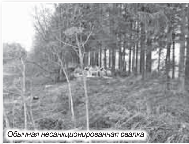
Обычная несанкционированная свалка

И все это идет в мусор. Иногда его сжигают в домашних и дачных печах, иногда — прямо во дворах. И тогда ядовитый дым стелется над дач-