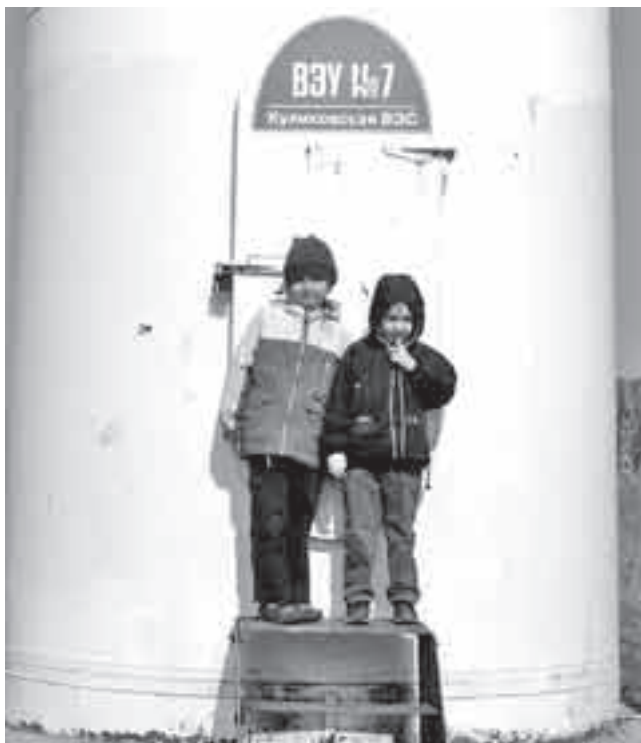
Для жителей Калининградской области ветропарк является предметом гордости

Зато кажущаяся бесхозность ветряков привлекает любителей традиционной российской забавы — оставить по себе память в виде неизбывного «здесь был Вася». Особенно досталось первому ветряку. Когда его установили, местные граждане бродили вокруг, безуспешно пытаясь залезть внутрь, а однажды исписали все основание башни нецензурными выражениями. Обозленные энергетики повесили табличку: «К ВЭУ