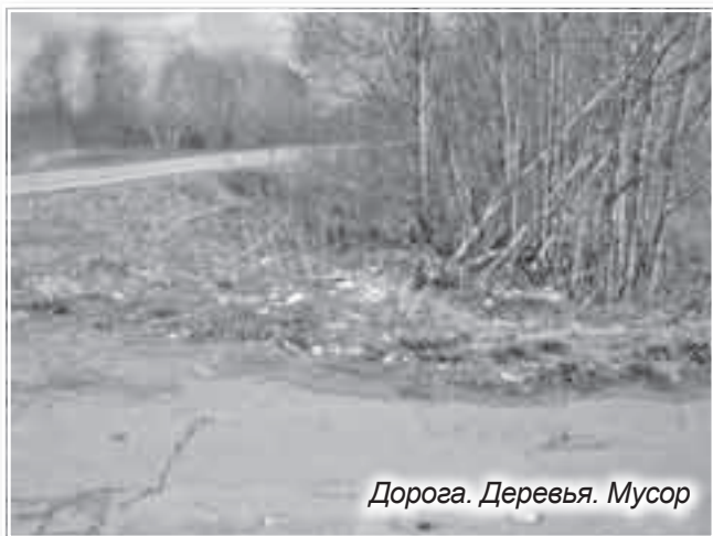
Дорога. Деревья. Мусор

ными участками и сельскими угодьями. Стеклотара, металлические банки из-под напитков и фольгированные упаковки не горят. А куда этот мусор деть? Инфраструктура, обеспечивающая утилизацию этого мусора, изменившись и увеличившись в объеме, развита в Ленинградской области явно недостаточно. Вот его и размещают вдоль дорог и автострад. Некоторые дачники довозят свой мусор до придорожных мусорных контейнеров. Но если такие и встречаются, то уже оттуда мусор вывозится очень редко.