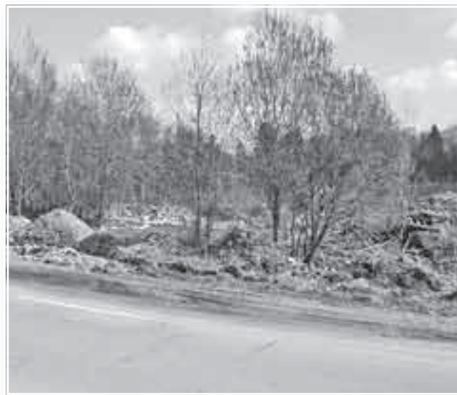
Мусор, мусор, мусор...

В соответствии со ст. 6.3 Кодекса об Административных правонарушениях за нарушение законодательства в области обеспечения санитарно-эпидемиологического благополучия населения, выразившееся в нарушении действующих санитарных правил и гигиенических нормативов, предусмотрена административная ответственность.