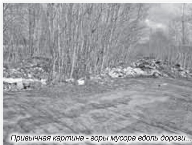
Привычная картина - горы мусора вдоль дороги...