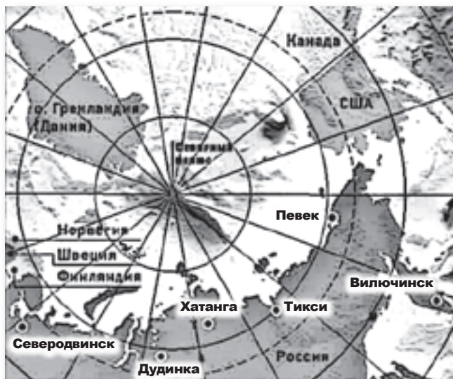
Предполагаемые площадки для размещения плавучих АЭС

По материалам этой экспертизы Центром экологической политики России и российским «Зеленым крестом» в 2004 году был издан доклад под названием «Плавучие АЭС России: