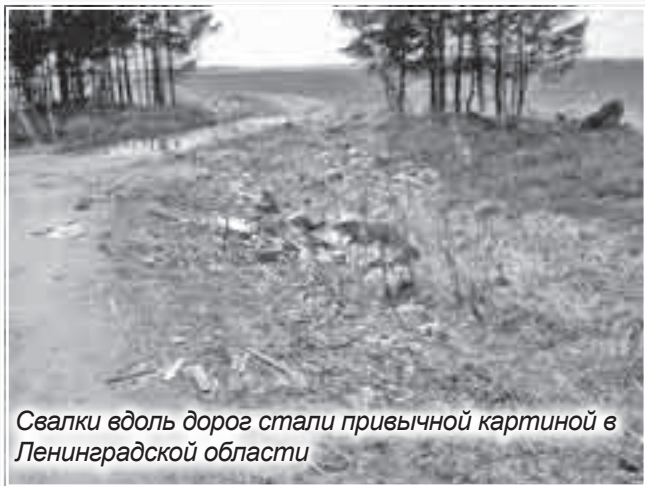
Свалки вдоль дорог стали привычной картиной в Ленинградской области