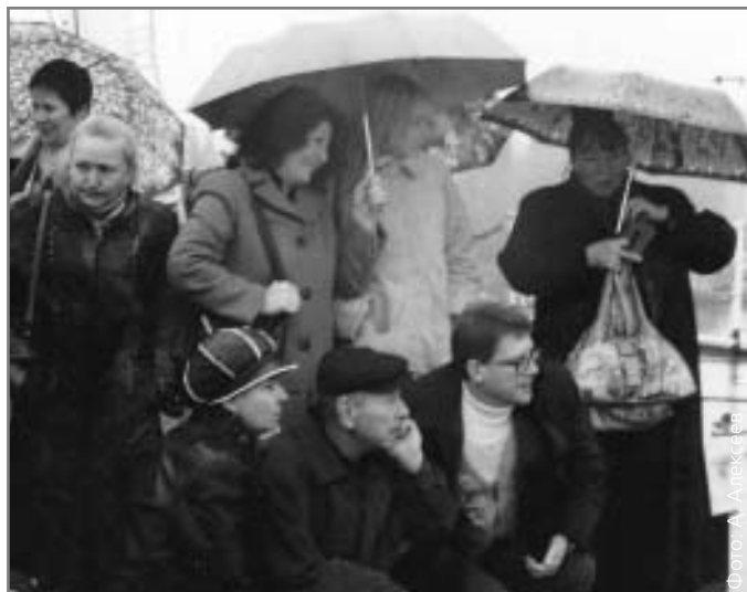
Журналисты-экологи на палубе судна-нефтеборщика «Смоленый»

IFEJ строит свою работу как глобальная сеть, по которой циркулируют не столько финансовые ресурсы, сколько информация. Удастся ли российским журналистам-экологам реализовать подобное взаимодействие во всероссийском масштабе и какую роль в этом процессе сыграет гильдия Медиасоюза, пока не ясно.