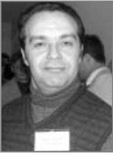
Журналист и литератор Виктор Шендерович

Мы-то думали, что мы от цензуры переходим к свободе массовой информации, к медийному рынку. На самом деле мы перешли в несколько иное состояние».