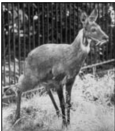
Дальневосточный олень кабарга — под угрозой исчезновения

Для эффективного функционирования экологического правопорядка, на мой взгляд, необходима координирующая деятельность соответствующих государственных органов и их конструктивное взаимодействие с предпринимателями и общественными объединениями. Отводя государству ведущую роль в управлении экологическим правопорядком, я считаю, что выполнение этой функции возможно и через общественную структуру. К таковой я отношу общественное Уполномоченного по экологическим правам человека.