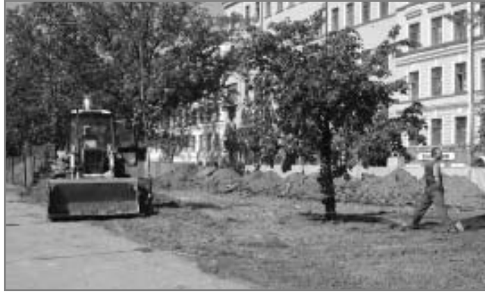
Большой проспект: работы в самом разгаре

Все эти действия совершались ЗАО «Просперити» несмотря на то, что к тому моменту Главное управление природных ресурсов и охраны окружающей среды по Санкт-Петербургу и Ленинградской области Министерства природных ресурсов РФ предписало приостановить проведение работ по реконструкции Большого проспекта в связи с отсутствием положительного заключения государственной экологической экспертизы по проектной документации. Инспекторская проверка деятельности ЗАО «Просперити» состоялась еще 9 июля. В результате было установлено, что требования природоохранного законодательства не были выполнены, то есть тем самым