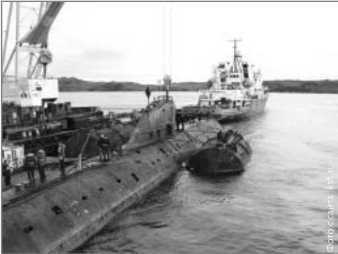
Состояние лодки и привязанных кней понтонов предрешило трагический исход