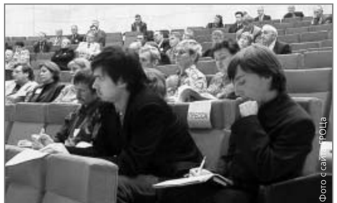
Пресс-конференция в ГРОЦе Минатома

Вообще специалисты, которым Минатом доверил свои связи с общественностью, за редким исключением смотрелись до-