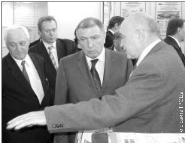
Министр науки, промышленности и технологий Илья Клебанов осматривает стенды выставки «Атомная промышленность»