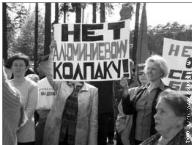
Митинг жителей г. Сосновый Бор против строительства алюминиевого завода.

Пока эксперты Горизбиркома, а затем Собрания представителей анализировали легитимность вынесенных на голосование вопросов, пока проводился сбор подписей, открылся счет в банке, наступила середина сентября. Окончательное решение о проведении референдума городской парламент принял только 15 сентября. Но за несколько дней невозможно собрать сумму в сотню тысяч рублей, напечатать бюллетени, провести агитацию... Вот почему депутаты назначили народное волеизъявление на 7 декабря — день Думских выборов.